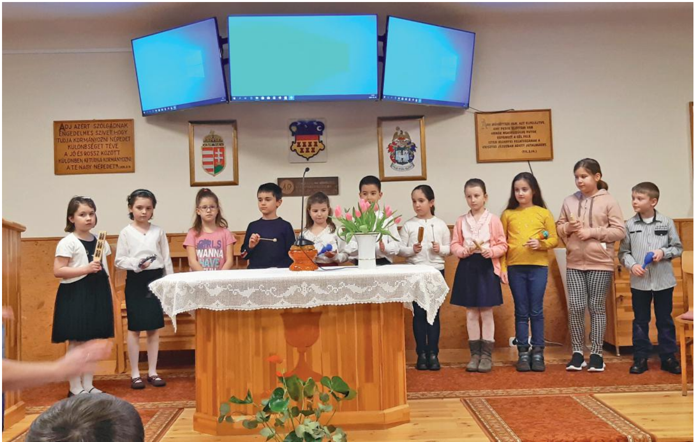
A gyerekek énekes-hangszeres szolgálata 2. b osztály

„Dicsérjétek az Urat! Dicsérjétek Istent szentélyében... Dicsérjétek kürtzengéssel, dicsérjétek lanttal és hárfával! Dicsérjétek dobbal kör-táncot járva, dicsérjétek citerával és fuvalával! Dicsérjétek csengő cintányérral, dicsérjétek zengő cintányérral!...” Zsoltárok 150, 1a 3-5.