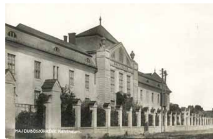
A hajdúböszörményi Kálvineum