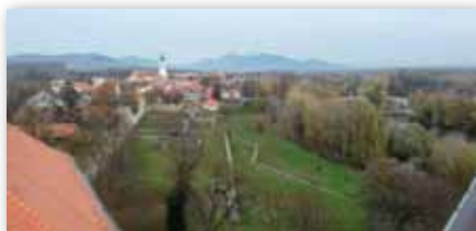
Kilátás a Rákóczi-várból