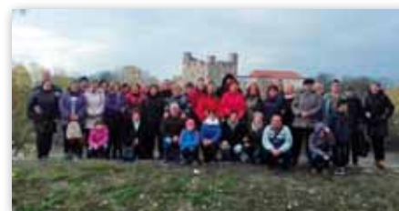
A Kálvin János Református Szociális Szolgáltató Központ néhány dolgozója a Rákóczi-vár előtt