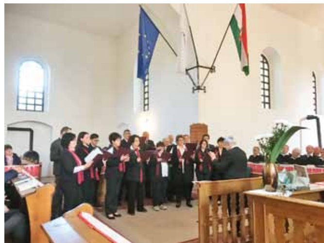
Kálvin téri kórus