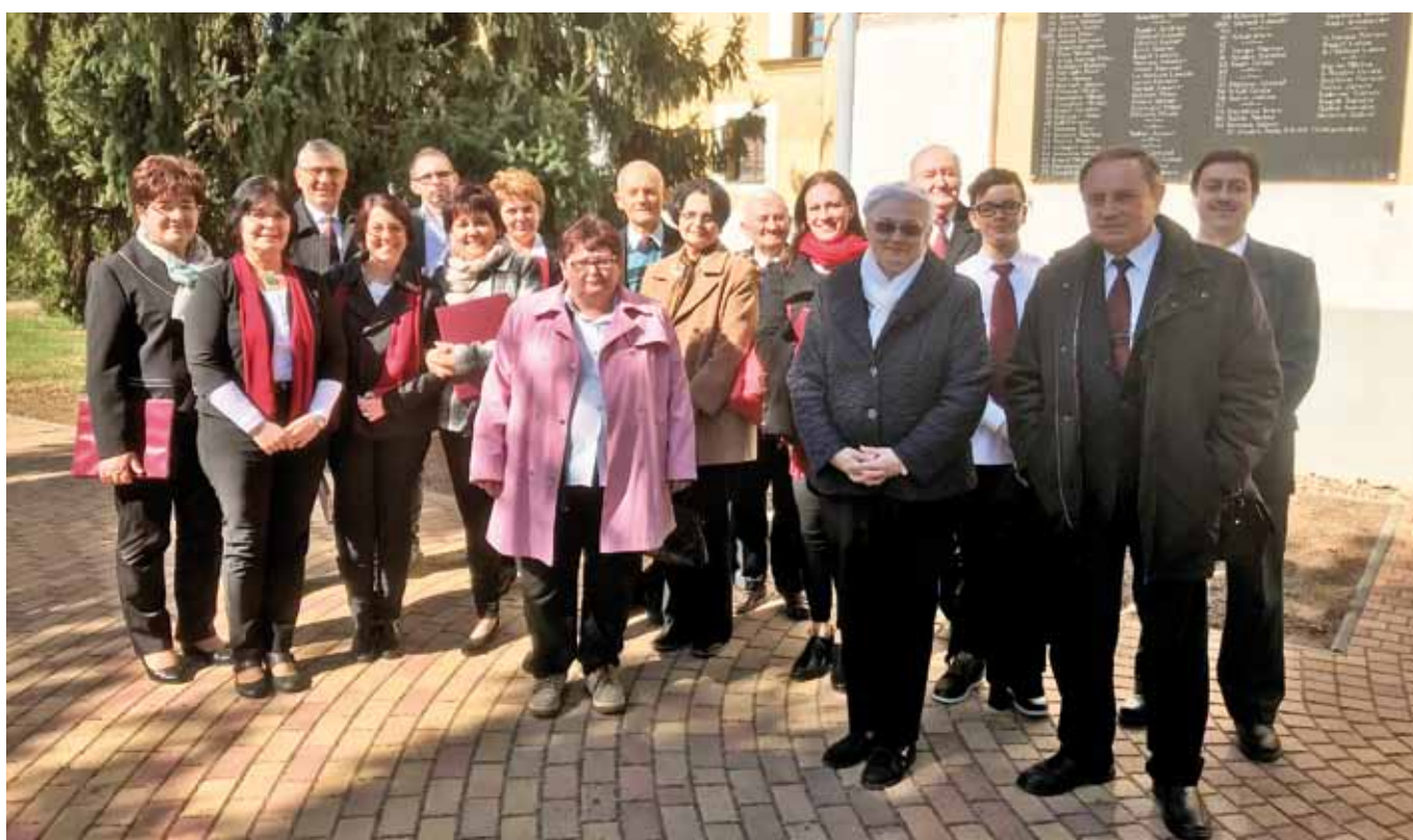
Kálvin téri kórus