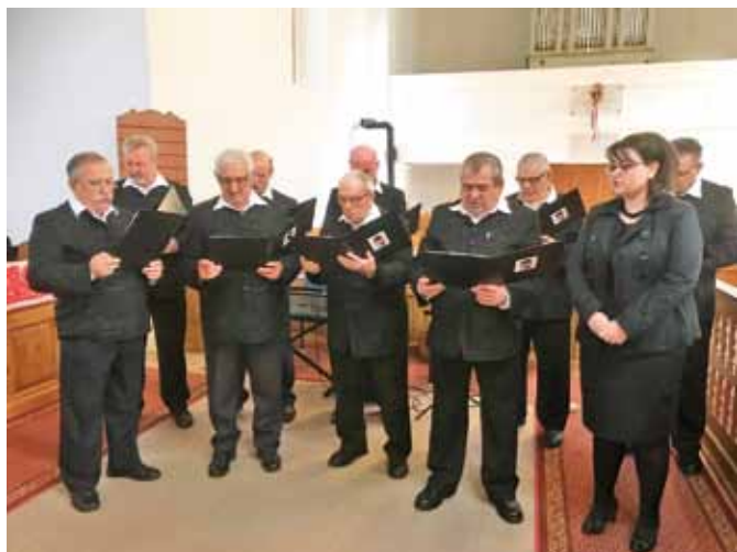
Biharnagybajomi férfi kar