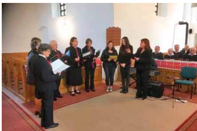
Nádudvari női kar