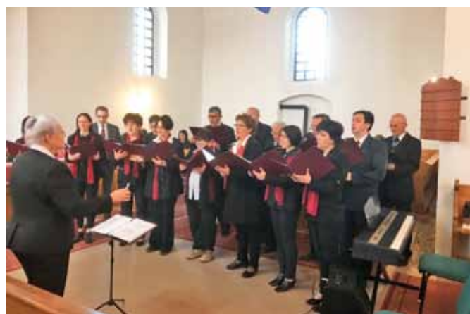
Kálvin téri kórus